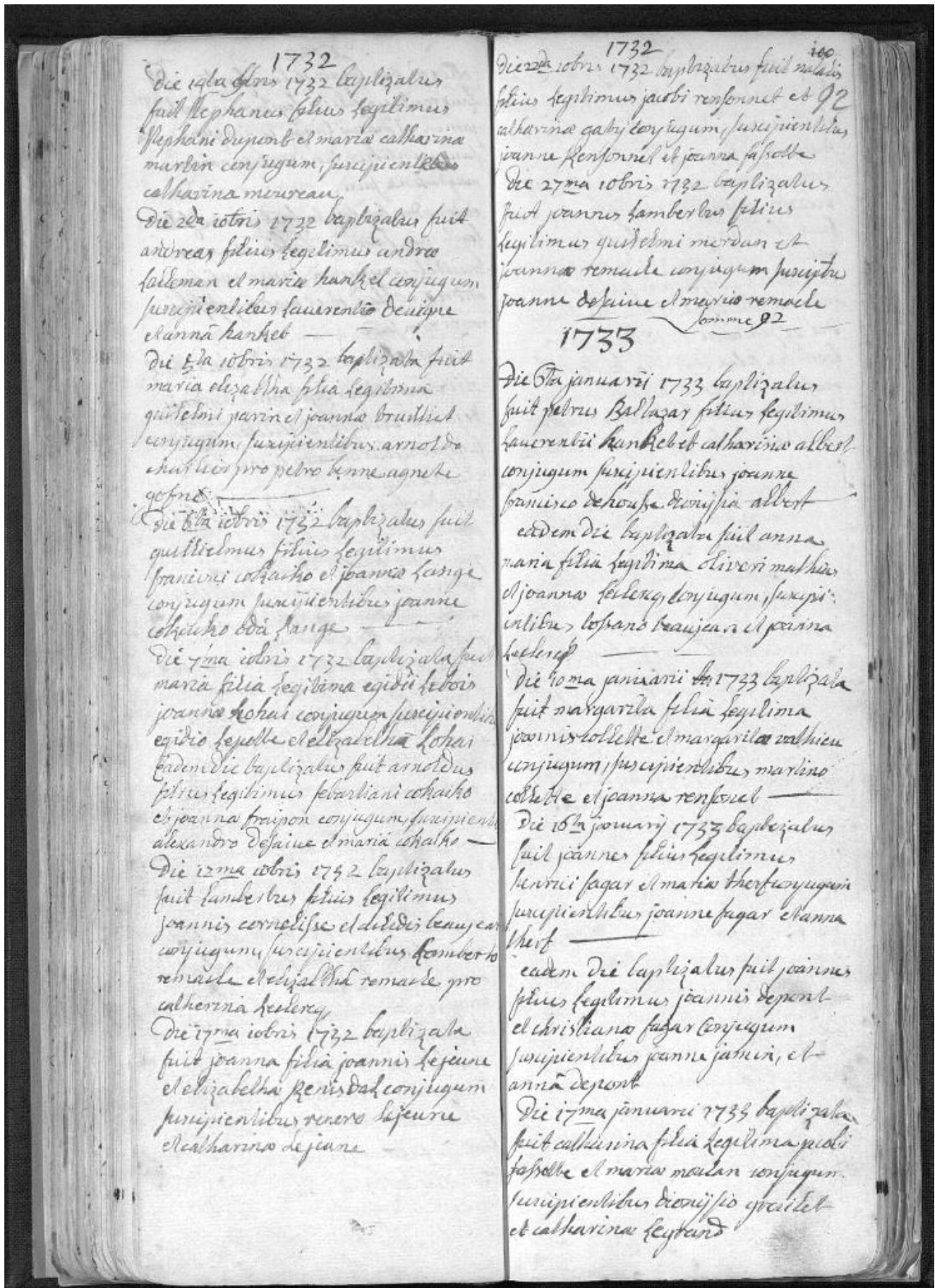
Dies ist ein handgeschriebenes katholisches Taufregister (Kirchenbuch) in lateinischer Sprache. Es dokumentiert Taufen aus den Monaten Oktober bis Dezember 1732 sowie Januar 1733. Solche Dokumente wurden vom örtlichen Pfarrer erstellt und sind oft die einzige Quelle für Geburts- und Familiendaten vor der Einführung der zivilen Personenstandsregister. Die Einträge folgen einer